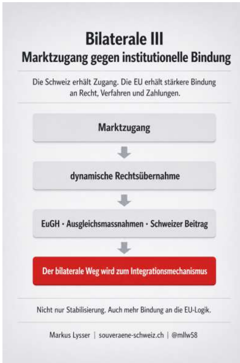
Grafik 1: Marktzugang und institutionelle Bindung

Diese Darstellung ist formal nachvollziehbar. Sie ist aber nicht vollständig. Wer nur die Begriffe „Stabilisierung“, „Rechtssicherheit“ und „Mitwirkung“ liest, erkennt nicht sofort, wo die politische Machtverschiebung liegt. Die entscheidende Frage lautet: Was muss die Schweiz künftig akzeptieren, wenn sie den Zugang zum EU-Binnenmarkt in diesen Bereichen sichern will?